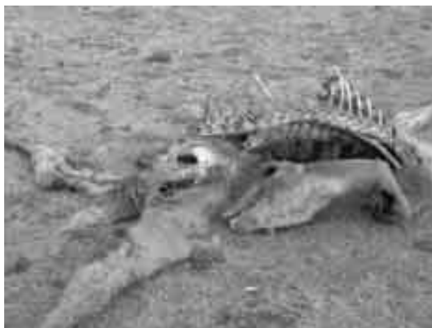
Figura 2. Vicuña atacada por depredadores

El zorro ( Pseudolopex culpaeus ) es otro depredador natural, que afecta principalmente a las crías de vicuña, cuyo número de muertes no está registrado.