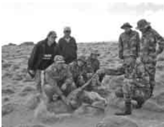
Figura 1. Vicuña atacada por perros (11 nov 2006)

En Bolivia existe cacería furtiva y ferias populares, donde se comercializa la fibra y productos artesanales de la fibra de vicuña. Ambas actividades son ilegales y se encuentran dentro de una problemática compleja, debido a diferentes factores que van desde la competencia alimenticia entre las especies domésticas y las vicuñas, hasta las condiciones de extrema pobreza que se encuentran algunas comunidades campesinas y originarias.