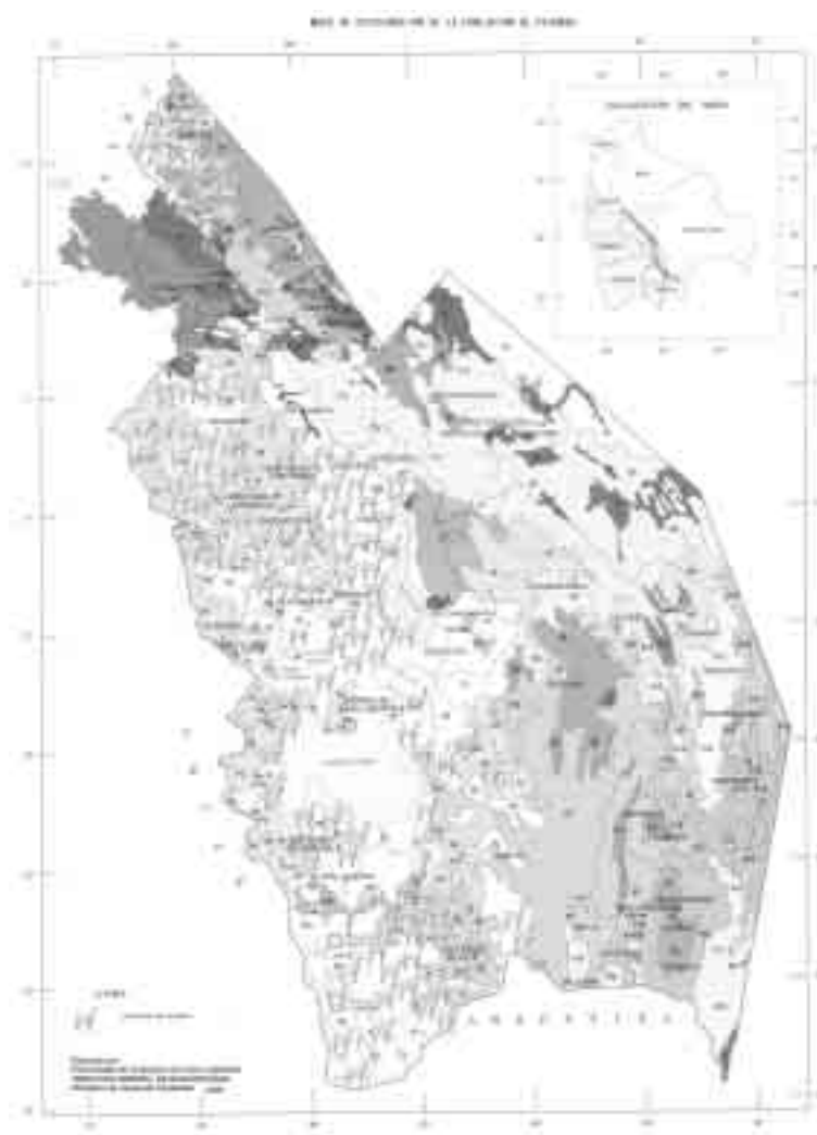
Mapa 1. Distribución de la vicuña en Bolivia