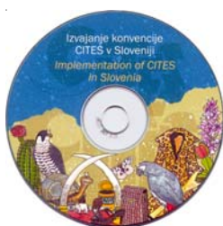
Las últimas producciones de la Autoridad Administrativa son un informe de cuatro años y un CD-ROM sobre la aplicación de la CITES en Eslovenia

Un representante de la Autoridad Administrativa de Eslovenia dicta regularmente conferencias en el curso Master “Gestión, acceso, conservación y comercio de especies: el marco internacional” en la Universidad Internacional de Andalucía y en el programa de postgrado “Protección del Patrimonio Natural” en la Universidad de Ljubljana. Las conferencias en colegios e instituciones nacionales como el Jardín botánico y el Museo de Historia Natural forman parte de las actividades de información del público de la Autoridad Administrativa. Se han presentado varias tesis sobre la CITES en la Facultad de Biotécnica de la Universidad de Ljubljana y la Facultad de Derecho de la Universidad de Maribor.