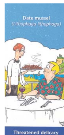
Diversos materiales de divulgación expedidos por la Autoridad Administrativa de Eslovenia