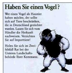
En el Zoo de Colonia se recomienda a los visitantes que insistan, antes de comprar un ave de compañía, en la presentación de las pruebas del origen, y a limitar cualquier compra a los especímenes criados en Alemania y, en caso de duda, a consultar con las autoridades locales encargadas de la conservación