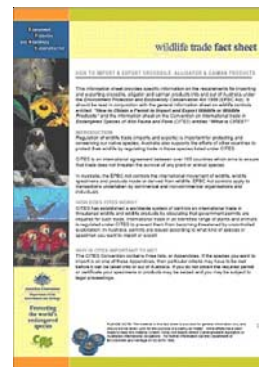
Australia produce hojas informativas con información sencilla sobre las especies comúnmente en el comercio

Las medicinas tradicionales chinas que contienen ingredientes como bilis de oso, especies de orquídeas y hueso de tigre se confiscan habitualmente a la entrada en Australia. Para reducir el número de productos importados ilegalmente, un folleto informativo titulado “ Wildlife conservation and complementary medicines ”, escrito en chino e inglés, se ha distribuido a los viajeros internacionales y a la principal asociación de Australia que representa a los vendedores al por menor y a los profesionales de la medicina china. Al representar un importante porcentaje, que va en aumento, de los artículos decomisados, el próximo año financiero centrará la atención en las medicinas tradicionales.