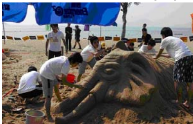
Un equipo realizando su escultura en arena en un concurso sobre la protección de especies en peligro