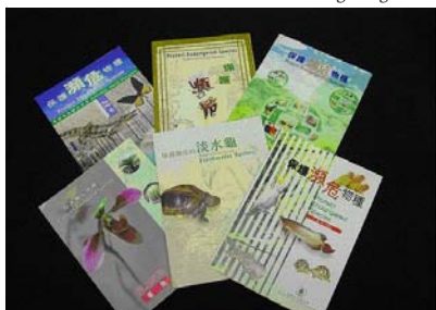
Folleto sobre varios temas producidos por la Autoridad Administrativa CITES de Hong Kong

CITES de Hong Kong mantiene un registro con información sobre más de 18.000 comerciantes. Asimismo, se buscan oportunidades para publicar artículos en revistas comerciales y distribuir folletos informativos a través de las asociaciones comerciales.