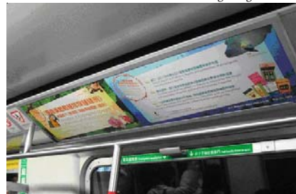
Publicidad en los trenes