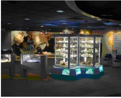
El Centro de recursos de especies en peligro