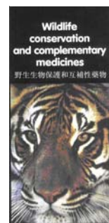
En el folleto “Wildlife conservation and complementary medicines” se ofrece información en chino e inglés. Se enumeran varios ingredientes normalmente utilizados en la medicina tradicional china que están sujetos a la reglamentación CITES