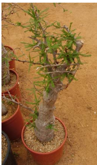
Operculicarya pachypus, en culture